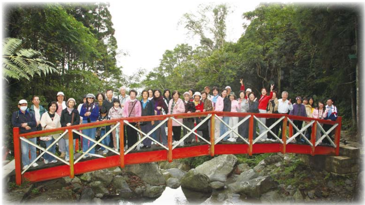
△2009.11.14 社區一日遊 關西-馬武督森林